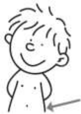
legs / tummy