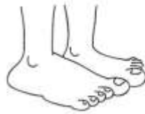
fingers / toes