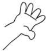
head / hand