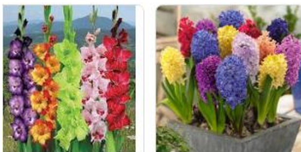
Mieczyki i hiacynty.