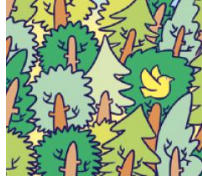
forest - las