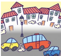
town - miasto

W celu zapamiętania wyrazów, rysuj w powietrzu kształt wybranego elementu krajobrazu i podaj jego nazwę.