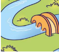
river – rzeka

dzisiaj poznacie nazwy elementów krajobrazu. Spójrz na poniższe obrazki. Jeżeli masz dostęp do eDesk wysłuchaj nagrania nr 2 z płyty nr 3.