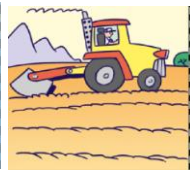
field – pole