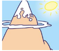
mountain - góra