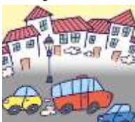
town - miasto

W celu zapamiętania wyrazów, rysuj w powietrzu kształt wybranego elementu krajobrazu i podaj jego nazwę.