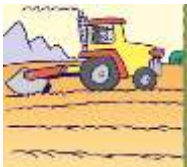
field - pole