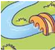
river - rzeka

dzisiaj poznacie nazwy elementów krajobrazu. Spójrz na poniższe obrazki. Jeżeli masz dostęp do eDesk wysłuchaj nagrania nr 2 z płyty nr 3.