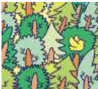
forest - las