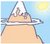
mountain - góra