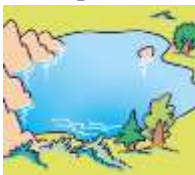
lake - jezioro