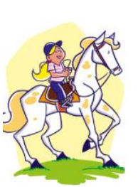
ride a horse