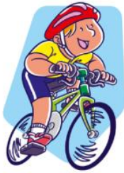
ride a bike